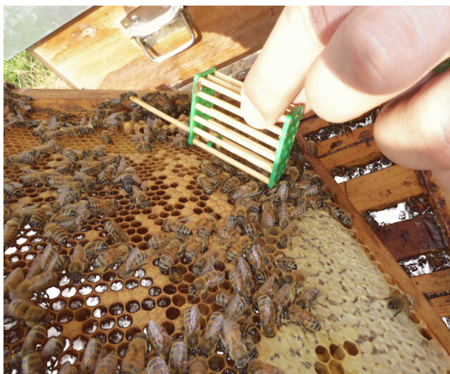
Foto 4. Blocco di covata su favo orizzontale