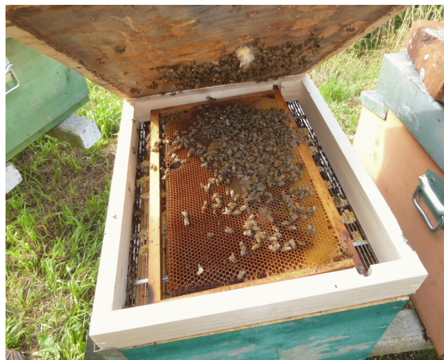
Foto 5. Cattura della regina per il blocco di covata con ingabbiamento della regina