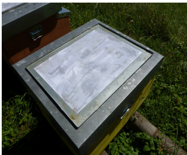
Foto 3. Vassoi dei fondi antivarroa spalmati di vasellina

Prelevare un campione di api dalla periferia della colonia (circa 50 g di api) riempiendo un flacone da 120 ml.