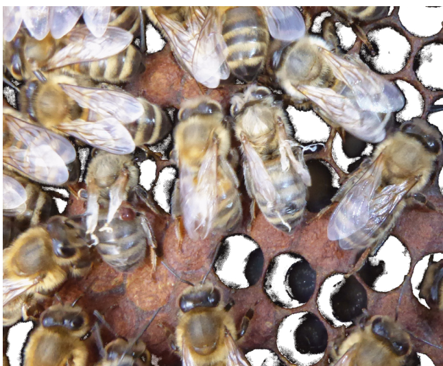
Foto 2. Api operaie con gravi sintomi del Virus delle ali deformi

vasellina per garantire un'efficace conta della caduta di acari durante il trattamento.