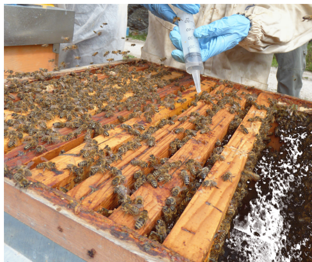
Foto 6. Applicazione dell'acido ossalico gocciolato in colonia priva di covata opercolata dopo l'applicazione di una delle tecniche apistiche