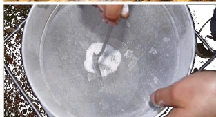
Figura 1. Schema dell'esecuzione del monitoraggio della Varroa sulle api adulte con il metodo dello zucchero a velo (ZAV)