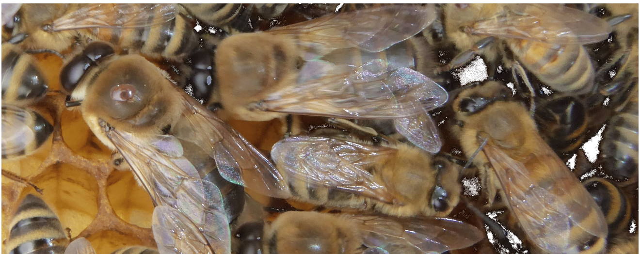
Foto 1. Fuco e ape operaia con Varroa destructor

castagno e tiglio e le api in molti casi non sono riuscite ad accumulare adeguate scorte nei nidi. Si sono osservati inoltre rallentamenti se non temporanee interruzioni nella deposizione di covata e questo può aver influito sull'infestazione di Varroa nelle colonie. Da quanto riportato in genere dagli apicoltori a fine giugno, non sembra che ci siano infestazione particolarmente gravi da Varroa. In ogni caso i trattamenti estivi non sono certamente da ritardare per non mettere a rischio la salute delle colonie e la loro predisposizione ad un adeguato invernamento.